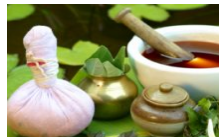
Evento – Como o Ayurveda pode mudar a sua vida 21 de junho de 2018