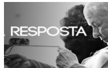
Onde está a verdade? Por Monja Coen 14 de junho de 2018