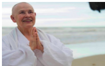
Hoje eu sei – Monja Coen 21 de julho de 2018