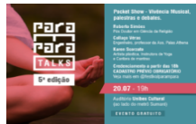
Como a meditação muda a sua mente e cérebro 16 de julho de 2018